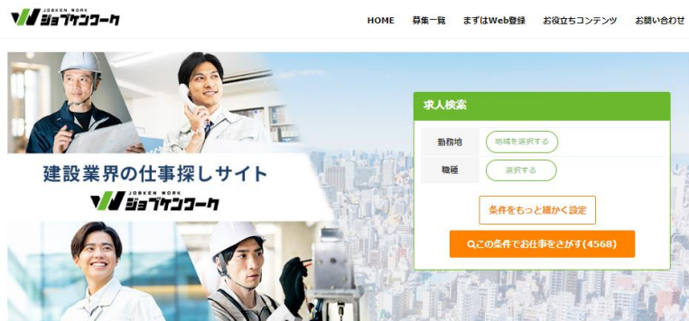
新着の求人情報一覧